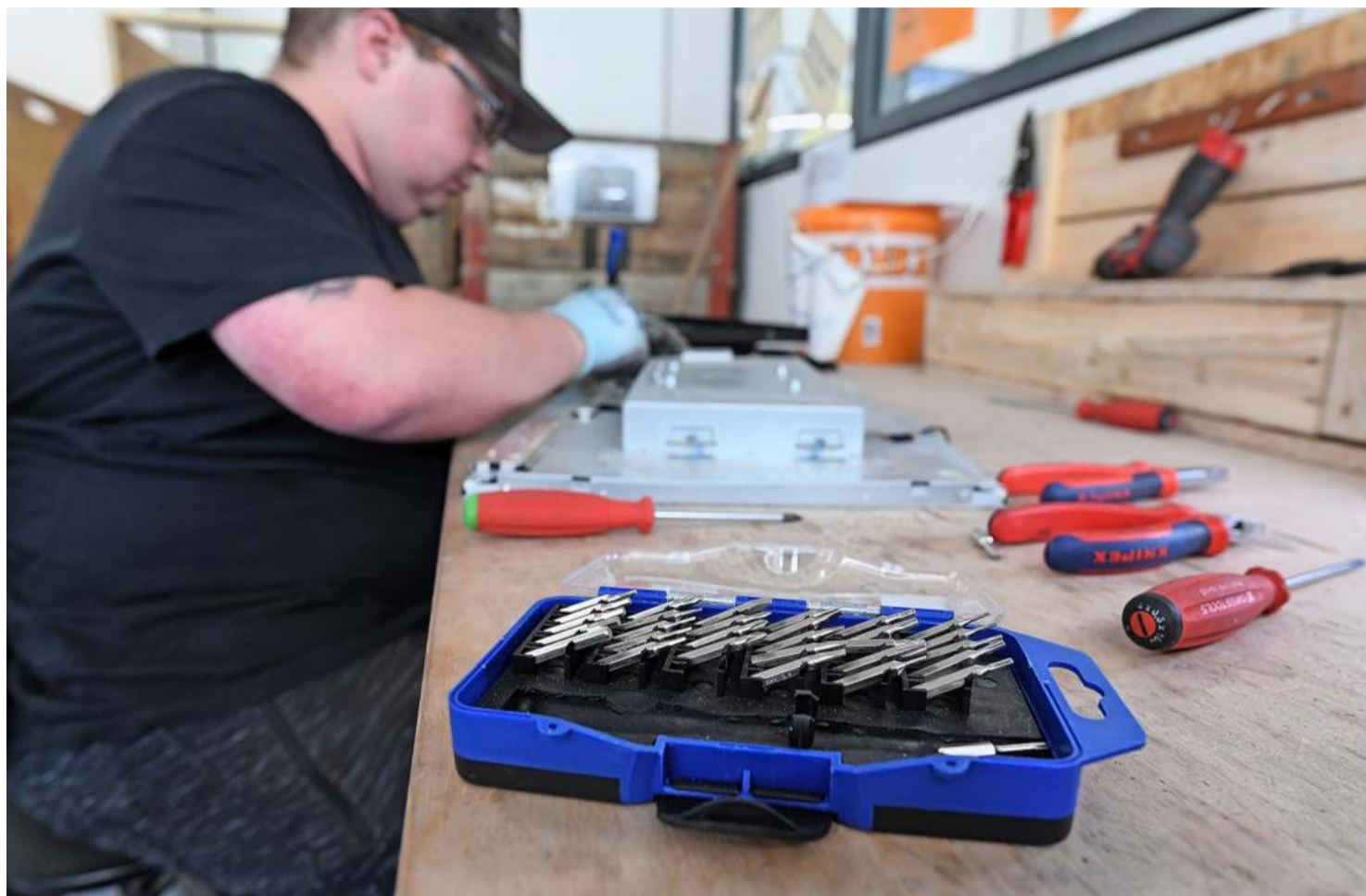
In der Wisli-Stiftung in Winterthur arbeiten Menschen mit einer psychischen Beeinträchtigung.