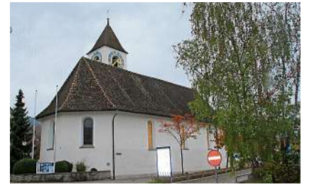
Die Kirchen verlieren weiter Mitglieder.